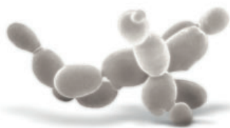
Lievito Saccharomyces cerevisiae (fonte: Lallemand) © Getty Image

Stress idrici eccessivi riducono l'attività fisiologica di base della pianta e possono arrivare a determinare danni permanenti all'apparato fotosintetico con disseccamento delle foglie e blocchi di maturazione, oltre ad una riduzione dell'accumulo di sostanze di riserva. LalVigne PROHYDRO , utilizzato prima dello stress idrico, consente una maggiore resistenza della vite al deficit idrico e permette un più rapido recupero quando l'acqua torna disponibile.